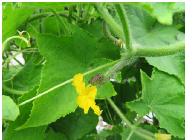
La cimice asiatica è estremamente polifaga.

I danni principali da parte della cimice si hanno sui frutti, che si manifestano come necrosi puntiformi sui tessuti molli (baccelli del fagiolo, bacche del pomodoro, cetrioli), mentre le punture sugli steli (asparago) portano al disseccamento della parte posta sopra alla puntura di suzione.